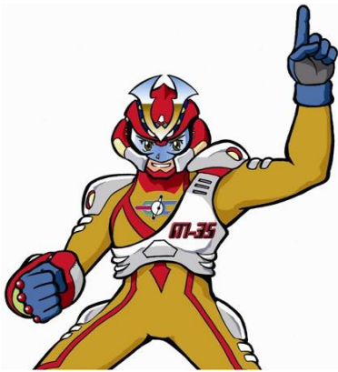
アースコマンド「エコレンジャー」