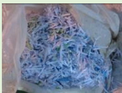
ミックスペーパー