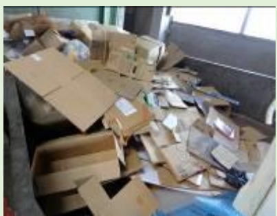
きれいな段ボール