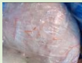
ビニール袋(廃プラ)