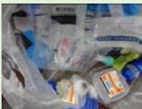
医療系廃棄物(廃プラ)