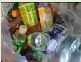
ペットボトル(廃プラ)

事業活動に伴って排出された廃プラスチック類や缶、ビン、ペットボトル、金属類は産業廃棄物になります。内容物検査を実施した結果、事業系一般廃棄物に混在して、これらの産業廃棄物が搬入されるケースが多く確認されています。