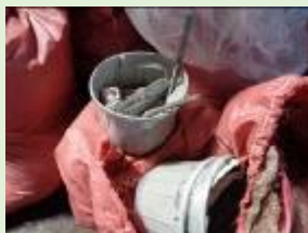
建設くず(業種限定)

これらは、全て 産業廃棄物です。 あつあいクリーンセンターで 処理することができません。