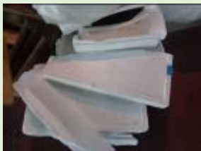
発砲スチロール(廃プラ)