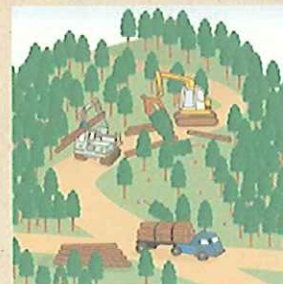
適切に森林整備を推進!

ことから、森林の土地の所有者の把握を進めるため、平成24年4月から森林法に基づく森林の土地の所有者となった旨の届出制度が創設されました。なお、この届出により、森林の土地の所有権の帰属が確定されるものではありません。