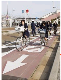
(例) 自転車専用道路等の整備