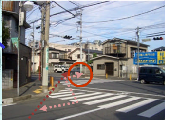
デザインされた入口案内等の整備をすることにより利用の向上を図る