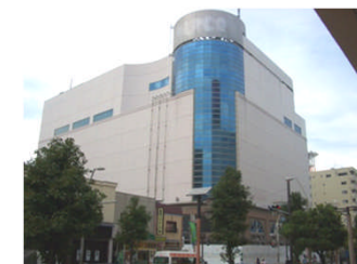
厚木パークビル(旧パルコ)