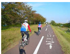
(例) 多摩川サイクリングロード