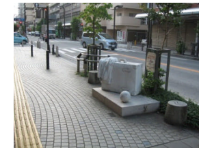
なかちょう大通り～中央通り 『モニュメント』