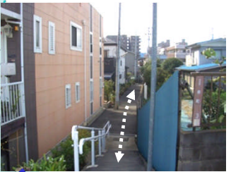
河川までのアクセスロード