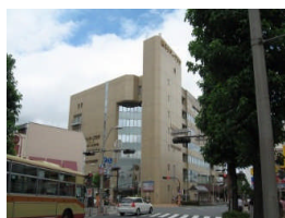
厚木シティプラザ