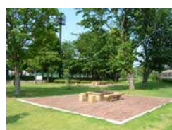
(例) 親水公園バーベキュー場