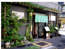
市民参加による景観 (例：緑による雰囲気づくり)