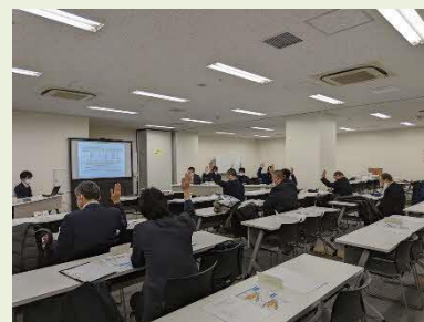
令和4年度臨時総会の様子