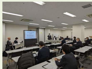
第3回全体会の様子