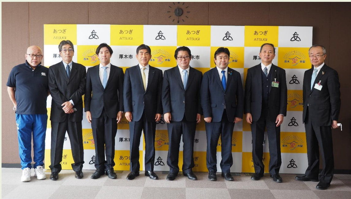
理事会による市長表敬訪問の様子