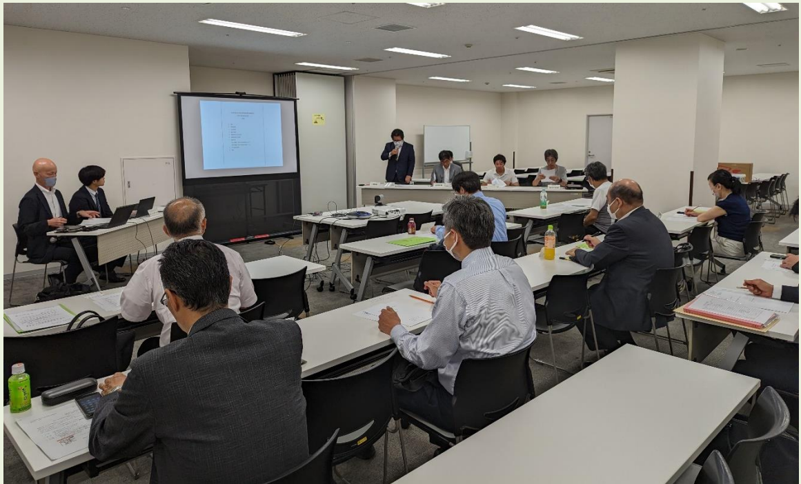
令和5年度通常総会の様子

本ニュース・活動に関するご質問、ご意見などございましたら、次の問合せ先にご連絡ください。