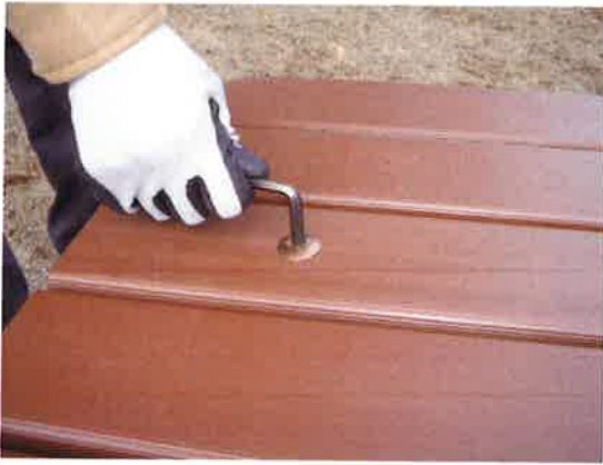
①専用工具で4ヶ所のビスを外し、