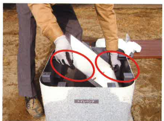
⑧持ち方を変えて、引き抜く。