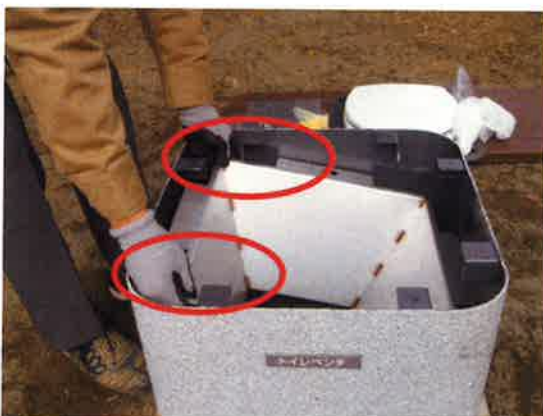
⑦両端を持ち上げ、斜めにして、