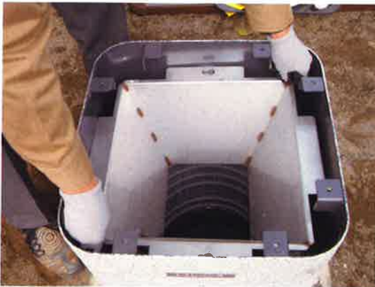
⑪便器マスのビス穴を合わせて、