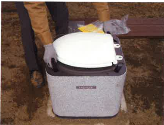
⑬便座を表向きにして、