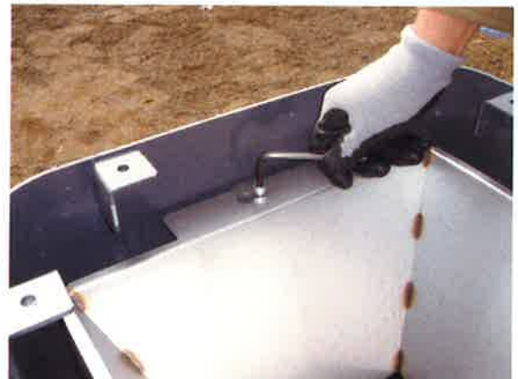
⑥専用工具で2ヶ所のビスを外し、便器マスを外す。