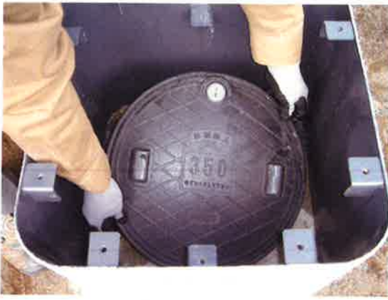
⑨便槽フタを取り外す。