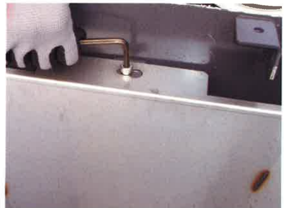
⑫便器マスをビスで止めます。