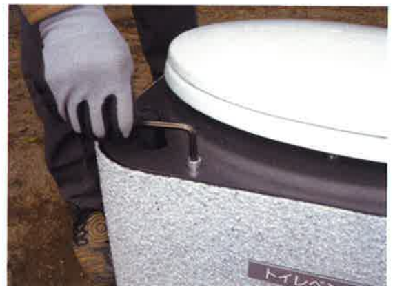
⑭便座をビスで止めます。