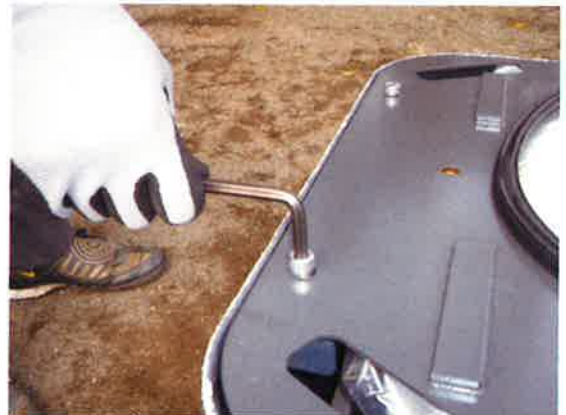
④専用工具で4ヶ所のビスを外し、