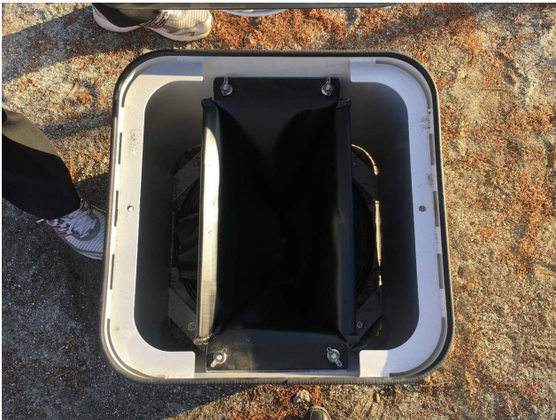
③便座付中フタを外すと便器マスがあります。