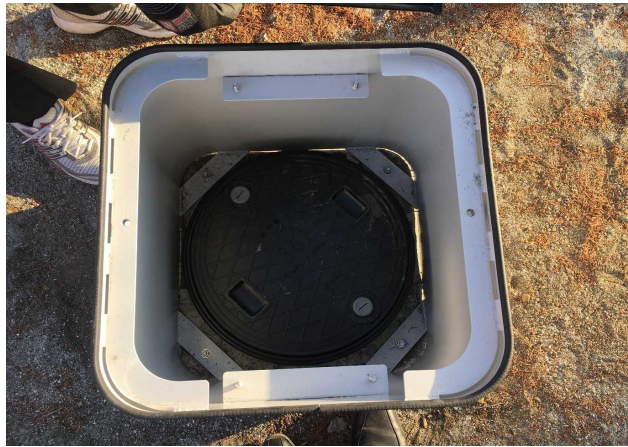
⑤便器マスを外すと下に便槽フタがあります。