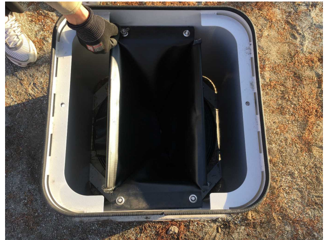
④便器マスを固定している蝶ナットを外します。 (指で回すことができます)