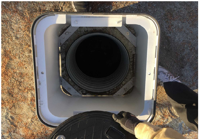
⑥便槽フタを外します。