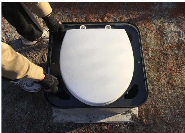
⑨便座付中フタを表向きにします。