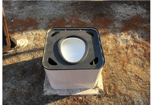
②穴に手を入れて便座付中フタを外します。