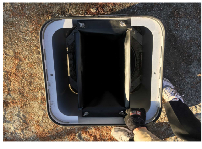
⑧便器マスを蝶ナットで固定します。 (指で回すことができます)