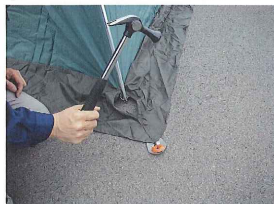
①⑫ テント裾部を固定します