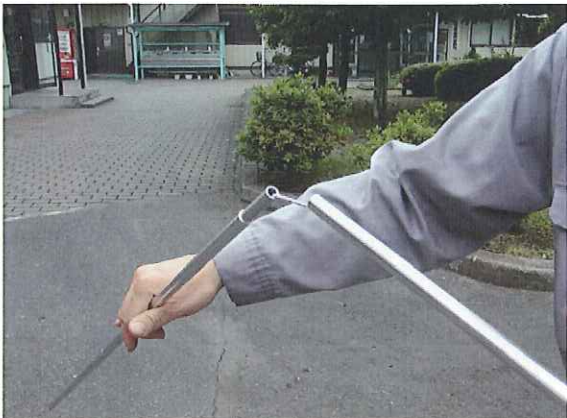
③柱部用折りたたみフレームを組み立てます