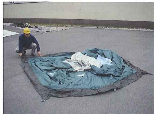
③テント(幕体)を広げます