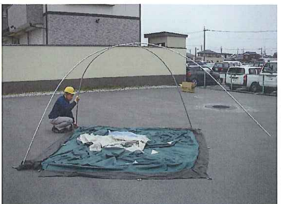
⑧四隅に差して、自立させます