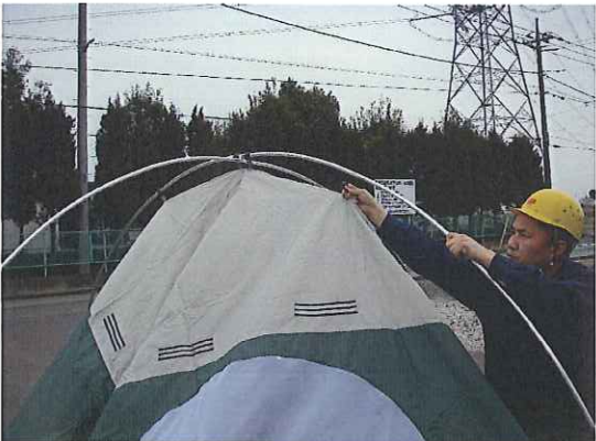
⑩上から順に掛けていきます