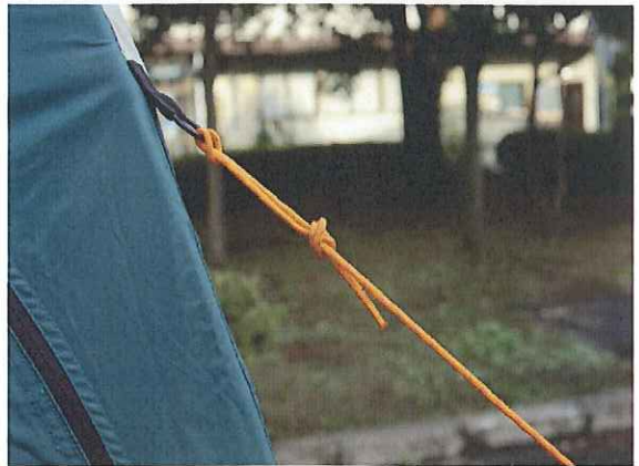
⑫張り綱を下に引き、リングに巻き付けます