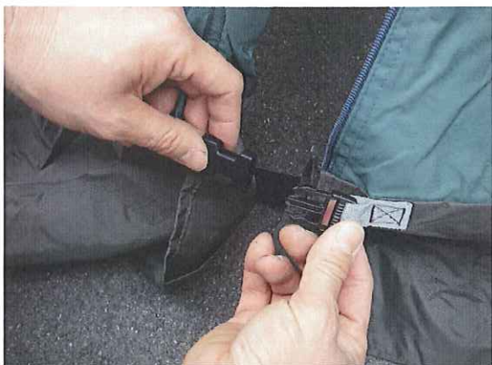
①⑩ 裾部のスツーパーを外します