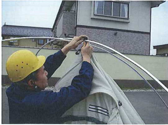
⑨幕体をフレームに引っ掛けます