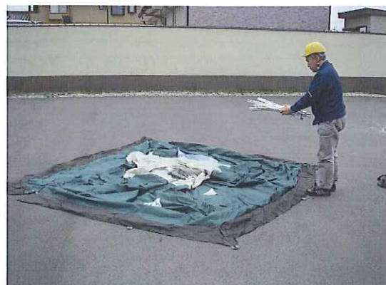
④一体型フレームを取り出します