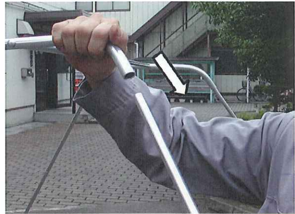
④天井部フレームに柱部フレームを差し込みます