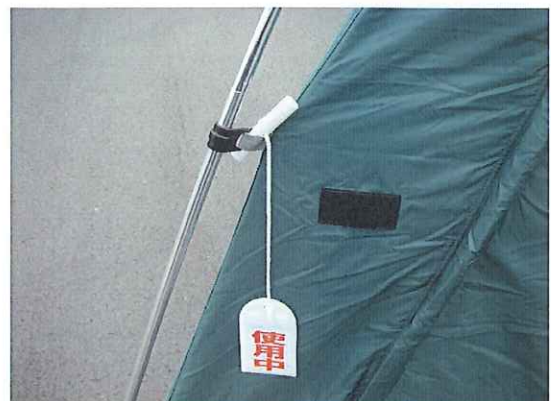
⑭フックの付け根にバーを差します