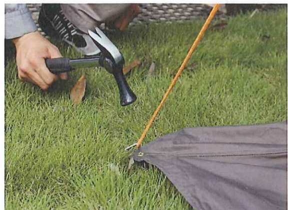
⑭土や芝、草地には付属のピンを打ち込みます