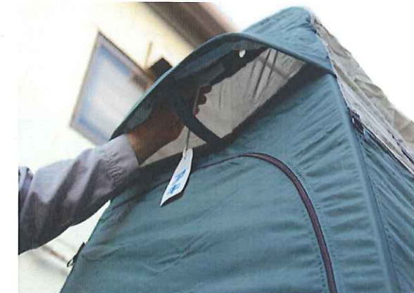
⑮「使用中・アキ」の表示板を上部穴にセットします