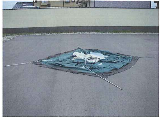
⑤フレームをテントの上に広げます