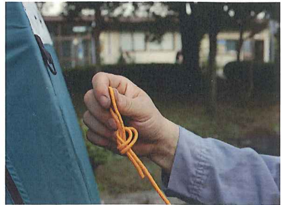
⑩張り綱を2重にして輪を作ります