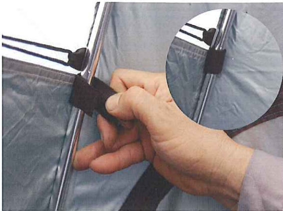
⑨テープをフレームに巻き付け固定します(14ヶ所)