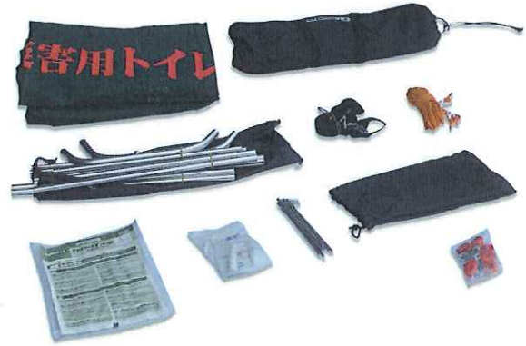
②梱包内容(ハンマーは別梱包)