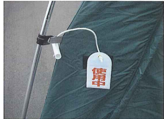
⑮表示板をマジックテープに貼ります