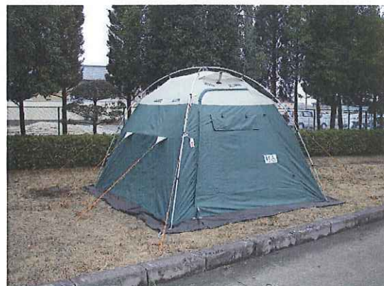
①⑭ 文字を覆った状態(他目的利用)