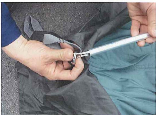
⑦フレームをテントのピンに差します