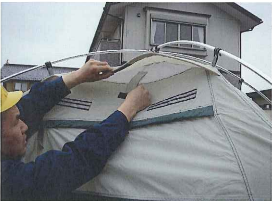
⑪ベンチレーターを引き出します