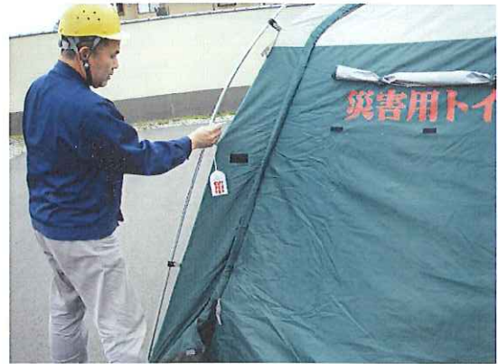
⑬トイレ表示板を取り付けます