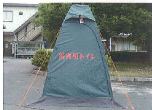
⑯災害用トイレテントの組立、設置完了