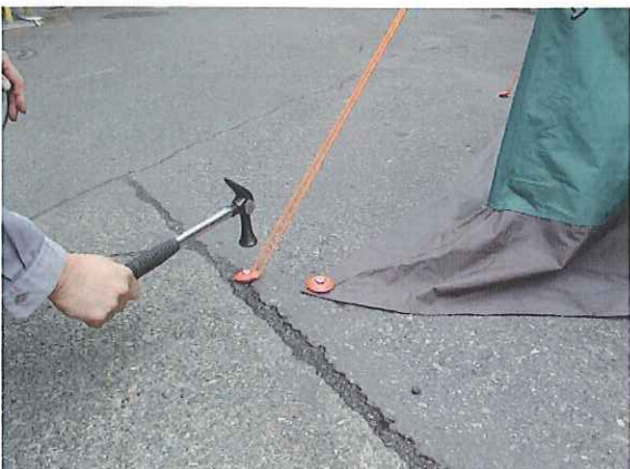
⑬ハンマーで止め金具を打ち込み張り綱を固定します