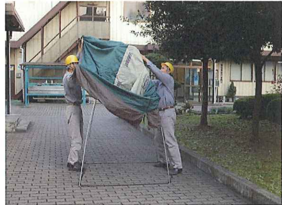
⑥テントの前後を確認して、フレームにかぶせます