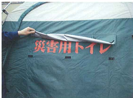
①⑦ 覆いを外し、文字を出します