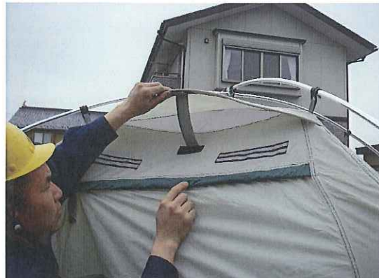
⑫テント内部の換気を確保します