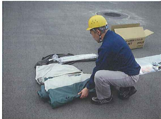
②テント(幕体)を取り出します