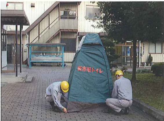
⑦テントの裾を均等に引っ張ります