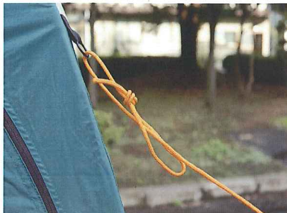
⑪外側上部4ヶ所のリングに張り綱を通します