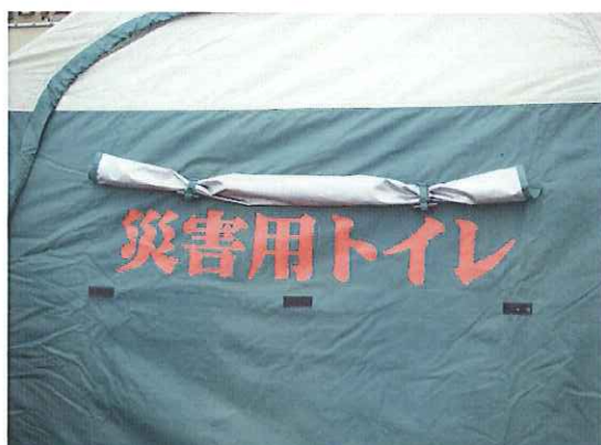
①⑧ 覆いを巻き上げます