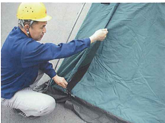
①⑨ 入口のファスナーを開けます