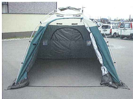
①⑪ 開けた状態です(バリアフリー)