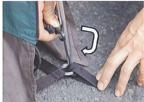
⑧テント裾部のフックを四隅のリングに引っかけます