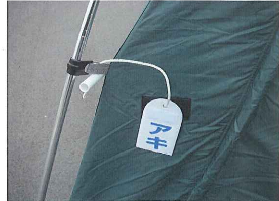
⑯使用後は、アキにしてください