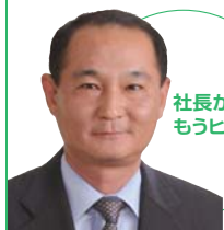
社長から、 もうひとコト

2003年発売のヒアルロン酸配合のスキンケア シリーズ「ジュジュ アクアモイスト」は、発売当時と しては画期的な配合成分を前面に打ち出す広告戦 略と、独特のテクスチャーが功を奏し、2011年ま での累計販売本数で約4,000万本を突破。また最 近では、シャンプー等のトイレットリー分野でも新 商品を送り出している。ここ厚木工場は研究開発機 能も持つ製造拠点である。