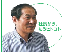
社長から、もうひとこと

力は、新規製品の開発を行う企業にも重宝がられている。たとえば、個人情報シールハガキ、植物由来の有機性資源を有効活用した建設現場などの粉塵飛散防止剤などはその一例。それらは、製靴が大幅に中国に移ったり、デジタルカメラの普及でフリーアルバムの需要が激減したりという業界環境の変化の中、レヂテックスの今後の活路を示す製品といえる。