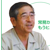
常務から、もうヒトコト

チフレーズとともに広く知られ現在に至る。しかし同社は、コンドームだけをつくっているわけではない。生活や流通の各シーンで使われるプラスチックフィルムの技術向上にも常に取り組み、ニーズにフィットした製品の開発に努めるほか、「ヘルスケア事業部」では福祉用具の製造や介護サービスも行っている。また、さまざまな社会貢献活動も積極的に行っている。