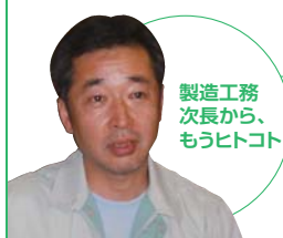
製造工務次長から、もうひとコ

国内外を問わず、顧客の幅広いニーズに対応し、高品質な製品の安定供給に努めています。