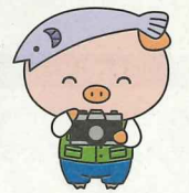
厚本市マスコットキャラクター あゆ回ちゃん