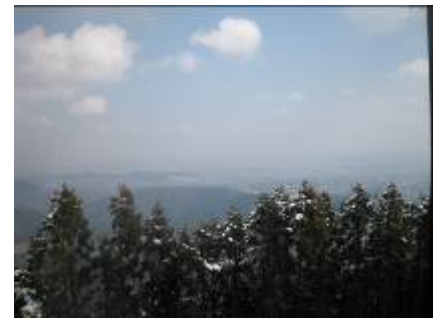
浅間神社からの壮大な眺め