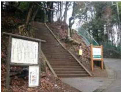
霊峰の雰囲気が漂う登り口