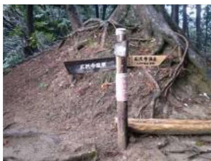
道標No14の先は分かれ道となっていて、左へ進むと鎖場(健脚向け)、右へ進むとらくらくコースとなる。