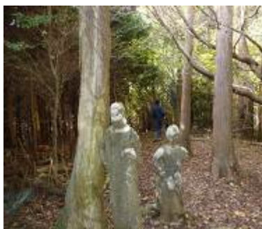
道中、多くの石像や石碑がハイカーを迎えてくれる。