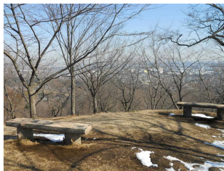
山頂には休憩用ベンチもある。