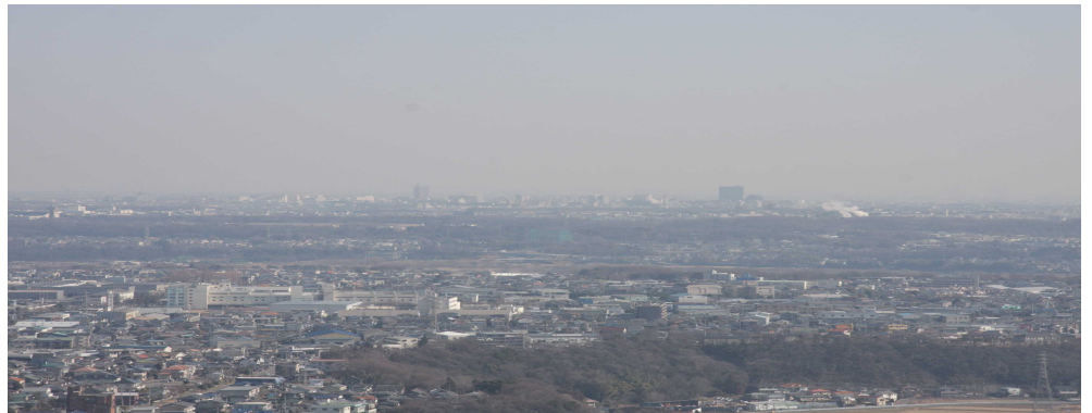
展望台からの眺め