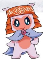
あばしりご当地キャラクター 「ニポネ」