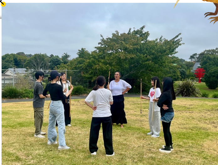
▲ 先住民族マオリの伝統的なゲームを体験

参加した高校生たちは、現地の学校への通学、ホームステイ体験、ニュージーランド文化の体験を通じて、英語力の向上はもちろん、国際的な視野を広げ、異文化への理解を深めました。