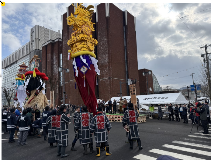
梵天まつりの会場

秋田県横手市で開催された「横手の雪まつり」に、公募による市民訪問団が訪問しました。かまくら、梵天まつり、生涯学習館Ao-na、横手市増田まんが美術館など、横手市を代表する冬の風物詩と市内施設を見学。古いものと新しいものが融合した横手市の独自の文化や魅力を感じることができました。参加者からは「次回は家族や友達と遊びに行きたい」といった声も寄せられ、友好都市への関心と愛着がより一層深まる貴重な機会となりました。