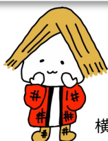
横手市のうめもの（美味しいもの） マスコットキャラクター「よこてん」