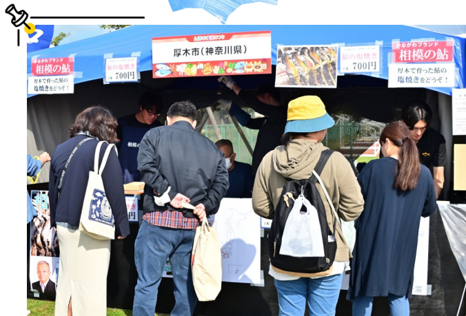
▲ 炉で焼き上げる鮎の塩焼きに足を止める来場者