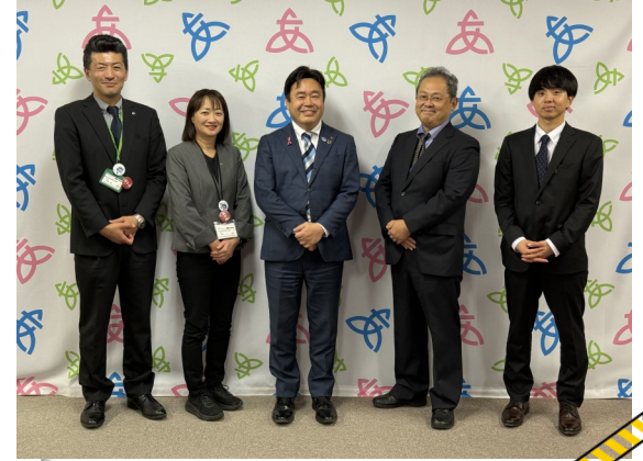
上：中央公園にて開催した友好都市物産展 下：表敬訪問にて横手市と網走市の職員と