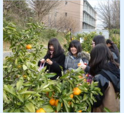
□網走市小学生厚木小学校での交流