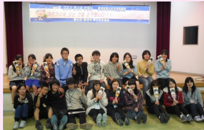
□厚木市の中高校生との交流会