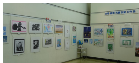
□展示コーナーの様子