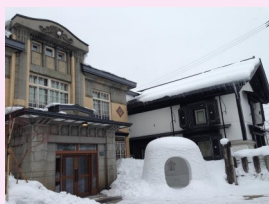
□友好交流委員会会長賞受賞作品 撮影場所: 横手市平原