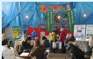
□海の幸が並ぶ物産展