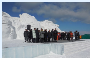
□流氷まつり開会式ステージ