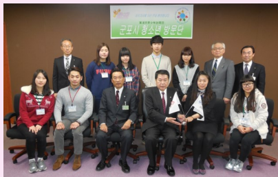
□軍浦市青少年訪問団 市長表敬訪問