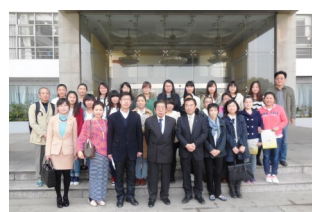
□揚州市職業大学にて

今年10月、厚木市と揚州市は友好都市締結30周年を迎えます。これまでの友好の歩みをたたえ合うため、両市での記念事業開催に向けて職員等による事前調整訪問を行いました。大学間交流や絵画・写真展の相互開催、訪問団の派遣など、友好都市の交流関係を更にいかし、両市の多くの方々に参加していただける記念事業を進めてまいります。