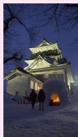
□友好交流委員会会長賞受賞作品 撮影場所: 横手城