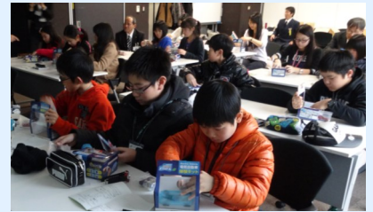
□日産での電気自動車(ミニカー)作り