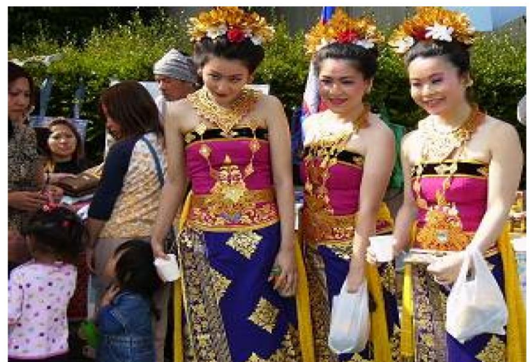
外国の美しい衣装を身にまとう女性

【内容】世界の人たちの華やかな舞台、外国籍市民のスピーチ、いろいろな国の人たちとお茶を飲みながらの交流会など。