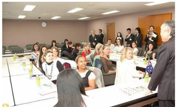
市役所を訪れたオーストラリアの大学生たち

オーストラリアの国立ニューカッスル大学と国立オーストラリアン・カソリック大学の学生男女計23人が11月28日に厚木市役所を訪問しました。2つの大学は、湘北短期大学の姉妹校の交流として、毎年訪問しています。学生たちは、11月24日～12月10日まで滞在し、30日には、厚木中学校を訪問し、交流を深めました。