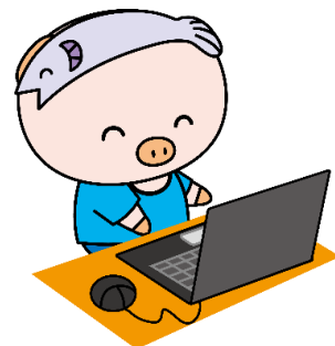
厚木市マスコットキャラクター