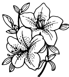
市の花 さつき —Azalea—