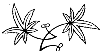
市の木 もみじ —Japanese maple—