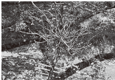
病気にかかった桜

おくと倒木の恐れがあり、損害賠償や人的被害なども考えられる。飯山白山森林公園の樹木にも見られるが市の見解は。