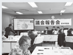
▲市民福祉常任委員会

市民の皆さまを対象に「少子高齢社会に挑む！」をテーマに対面およびオンラインで実施し、16人が参加。