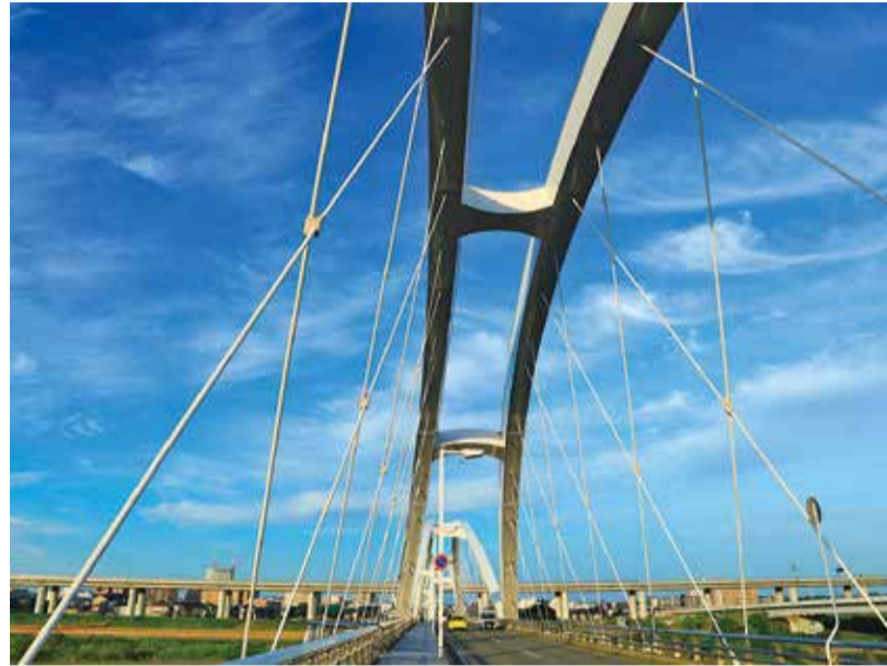
『あゆみ橋寸景』（あゆみ橋）

◎都市計画道路厚木環状3号線交差点改良工事道路に埋設された占有物の移設および撤去に時間を要したため、履行期限を令和6年10月31日まで（2カ月延長）とするとともに、必要となる現場維持費用として契約金額を6億493万5100円（350万7900円増）に変更するもの ◎補正後の予算額 1064億8262万9千円（26億8262万9千円増） ◎職員事務経費 令和6年度定額減税などに伴う人事給与システムを改修するための増額 ◎コミュニティ助成事業補助金 地域のコミュニティ活動に必要な備品を整備するための措置 ◎社会保険・税番号制度事務費 マイナンバーカード関連の手続き増加に備え、本庁舎に臨時窓口を設置するための増額 ◎住居表示台帳電子化等事業費 国の交付金を活用し、住居表示台帳の電子化などを行うための措置