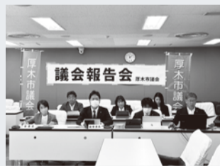
▲環境教育常任委員会

市民の皆さまを対象に「学校給食～食育と地産地消～」をテーマにオンラインで実施し、28人が参加。