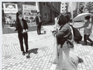
▲通行人にチラシを配布

厚木市スポーツ協会などの皆さまと「スポーツの聖地づくりについて」をテーマに対面で意見交換会を実施し、10人が参加。