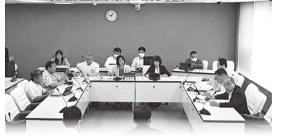
令和6年度一般会計・特別会計補正予算などの議案について、委員会・分科会での主な質疑と答弁を紹介します。