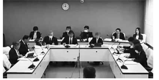
条例改正や令和7年度補正予算などの議案について、委員会・分科会での主な質疑と答弁を紹介します。