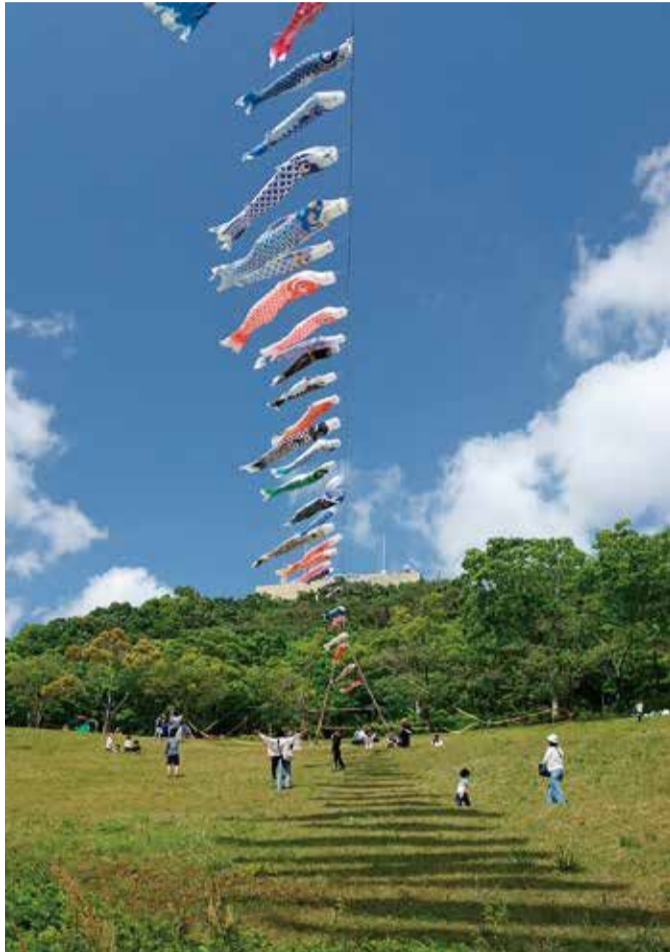
『こいのぼりの階段』（若宮公園）