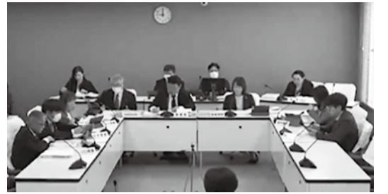
令和8年度予算の議案について、分科会での主な質疑と答弁を紹介します。