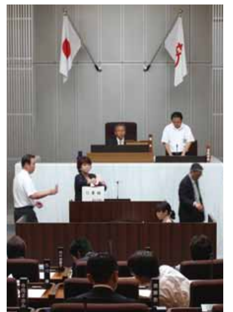
副議長選挙の投票風景