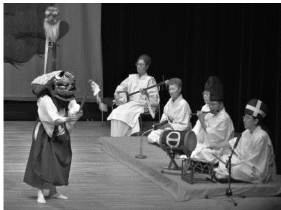
郷土芸能まつり(郷土芸能発表会／伊勢十二座太神楽獅子舞保存会)