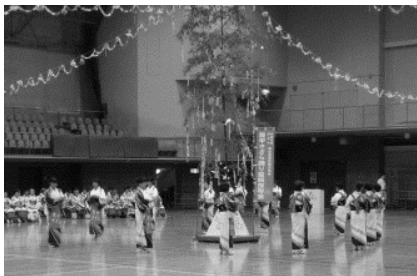
相模ささら踊り大会