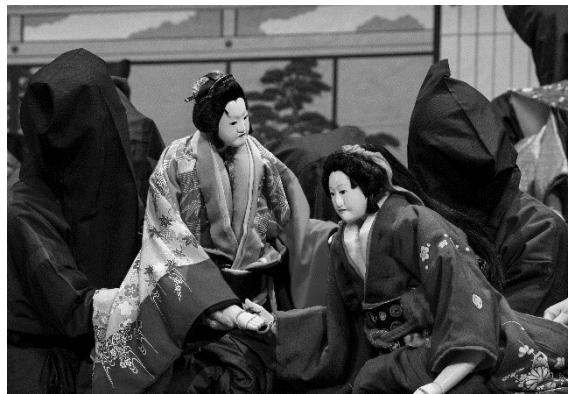
郷土芸能まつり(相模人形芝居特別公演／相模人形芝居 林座)