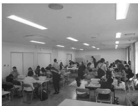
まが玉講座 初級編