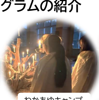
わかあゆキャンプ