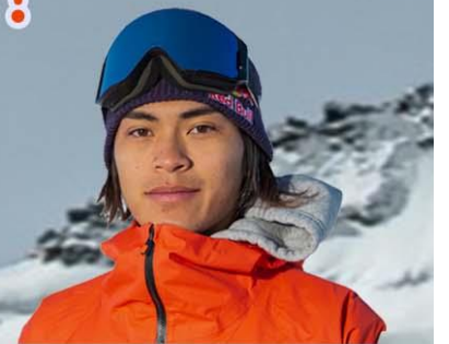
冬季Xゲームで過去2度優勝