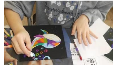
オリジナルの色で自分の作品を作ってみよう!