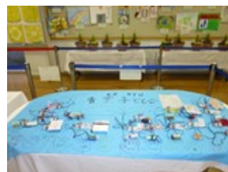
子どもたちの作品