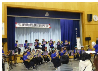
荻野中学校吹奏楽部

今年の公民館まつりは、作品展示は11月19日(土)から2日間、芸能発表は11月20日(日)に開催しました。芸能発表当日は、荻野中学校吹奏楽部の演奏からスタートし、開会式・荻野公民館功労者表彰の後に、地域の方々が日頃の活動の成果を披露しました。皆様、出展・出演・ご来場、ありがとうございました。また、従事された役員の皆様、大変お疲れ様でした。