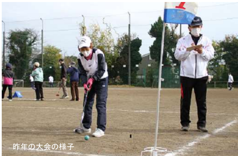
昨年の大会の様子

子どもから高齢の方まで誰もが楽しめるグラウンド・ゴルフ大会。みんな一緒に体を動かし、気持ちのよい汗をかきましょう！ペア戦ですので、親子、ご夫婦、友達同士などでご参加ください。