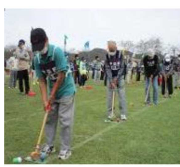
荻野地区大運動会