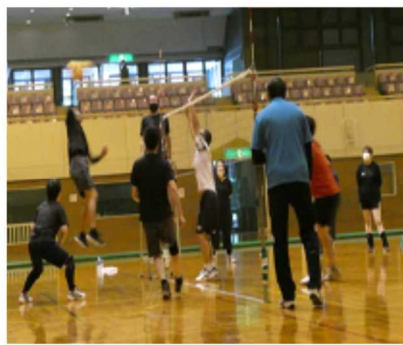
春季健康まつり球技大会