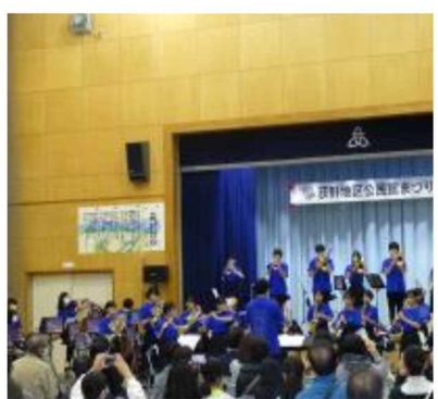
荻野地区公民館まつり