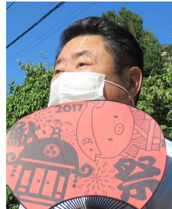
我慢は禁物ですね

夏本番、気温や湿度の高い日が続く中、新型コロナウイルス感染予防と熱中症予防を両立させる「新しい生活様式」に心がけましょう。