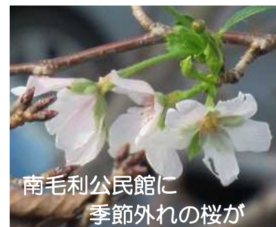
南毛利公民館に 季節外れの桜が

気温が不安定だったせいか、公民館東側の桜が、5輪ほど開花👏👏。 きっと南毛利小の子どもたちを歓迎してくれたの でしょう。