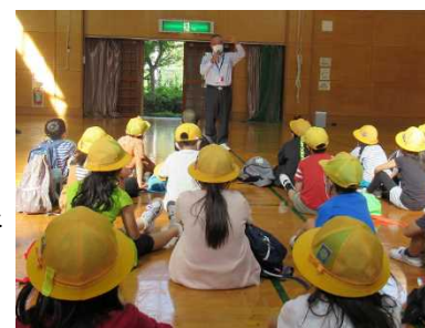
ようこそ公民館へ

当日は、2グループに分かれて来館。飛鳥井地区館長の歓迎あいさつに続き、担当者から公民館は生涯学習及び地域づくりの拠点施設のほか、災害時の避難場所としての役割も兼ねていることなどの説明を受けました。