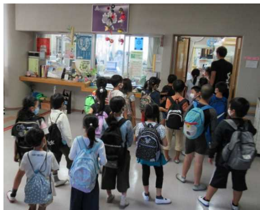
公民館スタッフとの交流も

一方、生徒の中から、「台風の時、何人避難してきたの？」との鋭い質問が。昨年の台風19号のときは、136の方が避難してきたとの説明に、生徒一同から「そんなに多いのかー」と驚きの声が上がりました。