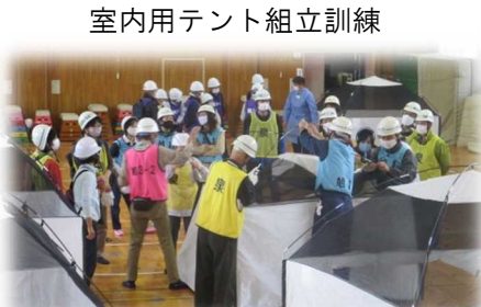
室内用テント組立訓練