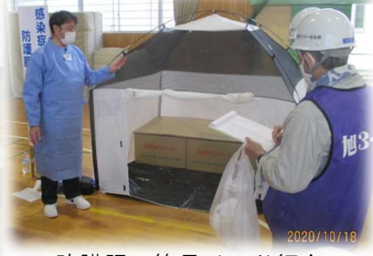
防護服・簡易ベッド紹介