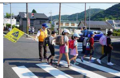
▲地域の人たちに見守られ、安心して登校する子供たち