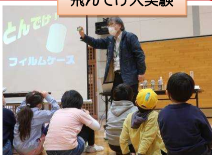
▲職員の話に耳を傾ける子どもたち

子どもたちの居場所づくりと地域のふれあいの推進を目的とする地域子ども教室。「飛んでけ大実験」を2月1日、開講しました。身の周りにあるモノを、いろいろな方法で飛ばす実験を神奈川工科大学厚木市子ども科