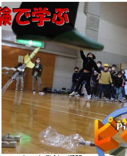
▲ロケット発射の瞬間

学館職員の指導で玉川小の1~6年生30人が体験しました。子どもたちは「教え方が分かりやすく、言うとおりにしたから楽しめたんだと思いました」「いろいろな仕組みについて分かってよかったです」「飛行機を飛ばすのが楽しかった。またやってみたいです」「ロケットがこんなによく飛ぶとは思わなかったです」など思い思いに感想を話していました。