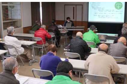
▲職員の話に聞き入る受講生たち