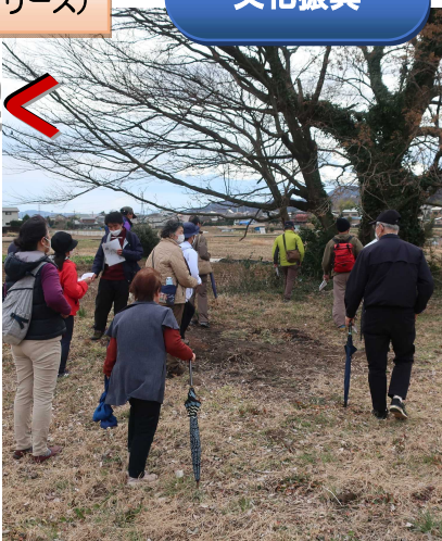
▲実時原古戦場跡を訪ねる参加者ら

11月12日、12月18日、1月22日、2月19日の4回シリーズで開講した「玉川地区の歴史を学ぼう」には、のべ72人の方が参加しました。寺社縁起から玉川地域の歴史と文化を紐解くなど、古代から江戸時代までの千年以上の歴史を3回の講義で学び、4回目には地域の史跡に足を運ぶことで史実を肌で感じとっていました。参加者からは「歴史を知った上で地域を見渡すと、新しい発見がありました」「地元でも知らないことが多いもんですね。勉強になりました」「特に実時原古戦場跡を歩いたフィールドワークが楽しかったです」など思い思いに感想を話していました。