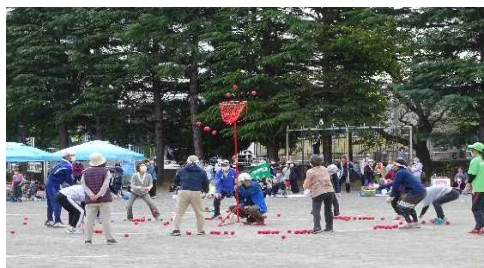
【緑ヶ丘地区大運動会】