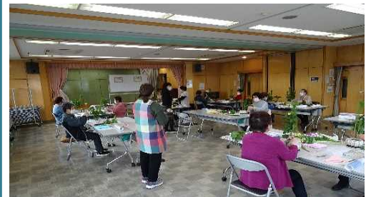
【フラワーアレンジメント教室】

地域の学習拠点として、地域の特性を生かした学習活動を通じ、地域における学習の充実を図る事業を実施します。