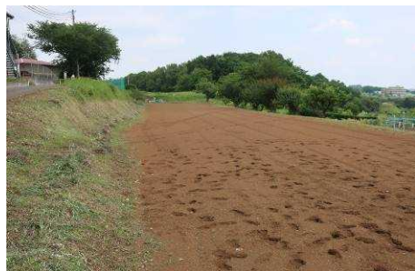
▲ひまわり畑となる岡津古久の現場 右上の建物が岡津古久老人憩の家

玉川小学校の児童たちの協力で、ひまわり畑を作る今年度の新たな事業計画が進行中です。畑は岡津古久老人憩の家向かい（東側）の畑で、広さ500㎡あります。今後、畑の除草作業などを経て、順調に生育してくれば8月初旬には一面の黄色い花のじゅうたんのようなひまわり畑が出