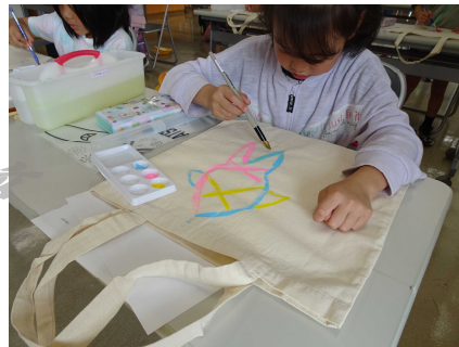
《作品を披露する子供たち》