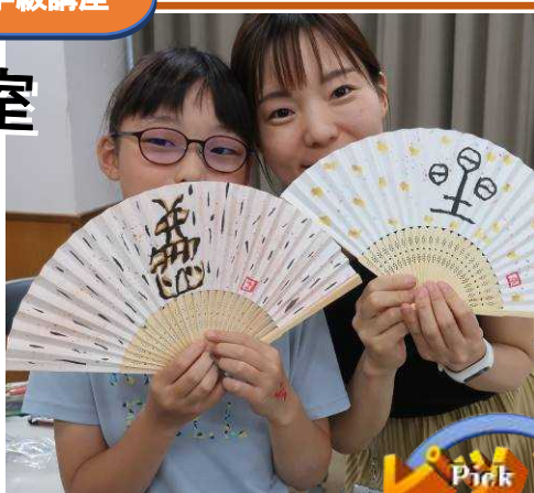
《作品を鑑賞し合う親子》

7月24日開講の親子扇子づくり教室には14組の親子が参加。扇子に扇型の絵をどうやって描くかの説明を聞いてから、まず「鮎」をテーマとする下絵を制作。その後、親子でデザインを相談したり、指導者からアドバイスをもらったりして、それぞれ思い思いの作品を仕上げていきました。保護者らは「実用的なものなので、子供と一緒に楽しく学べました。作って終わりではなく、なんども手にして見られるのがよいです」など嬉しそうに話していました。