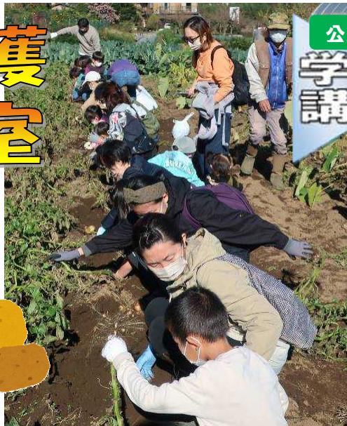
▲昨年のジャガイモ収穫の様子