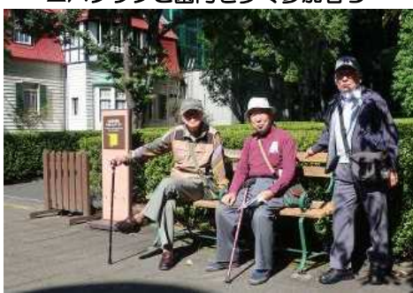
▲園内で小休止する参加者ら