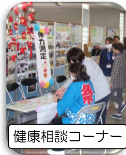
健康相談コーナー