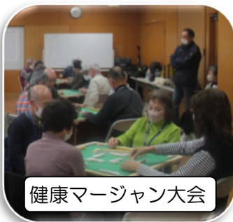
健康マージャン大会