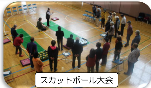
スカットボール大会