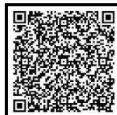
申し込み用 二次元コード