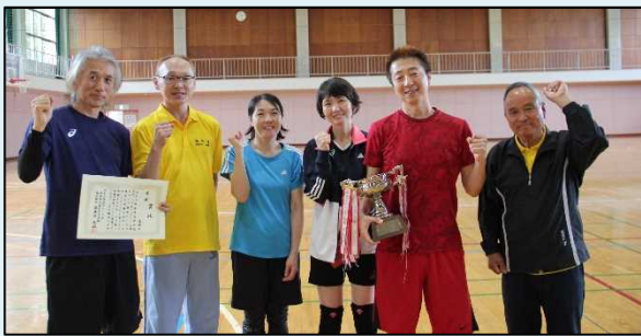
ソフトバレーボールの部 優勝 高坪A