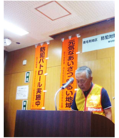
温水第2自治会長決意表明

講演では、特殊詐欺とは、心の隙に入り込む巧妙な手口で現金等をだまし取る犯罪を言い、一番の対策は、「電話に応答しないこと。留守番電話や防犯機能電話を活用し、必ず家族や誰かに相談する。」などの注意喚起がありました。その後、温水第2自治会長が安心・安全セーフコミュニティ推進地区決意表明を行い、自治会単位で各地域へ防犯パトロールに出発しました。