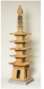
愛名宮地遺跡 出土瓦塔