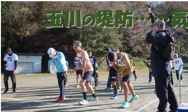
▲一般の部のスタート風景