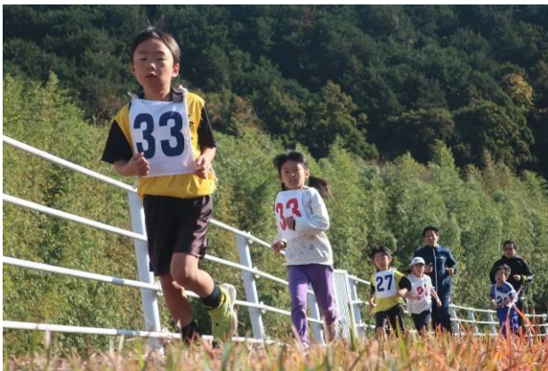
▲玉川堤防道路を走る子供たち

12月10日、森の里公民館と共催で開催している恒例の玉森(たまもり)マラソン大会は、25回目の開催。今回は4年ぶりに一般の部(4km)、ファミリーコース2部門(小学4年生以上/1.5km・小学3年生以下/1km)の3部門に男女71人が参加しました。玉川小学校を基点に玉川の堤防沿いを往復するコースを参加者らは、それぞれ自分のペースで走り、気持ちよい汗を流しました。部門別の上位3位までの入賞者は次のとおりです。