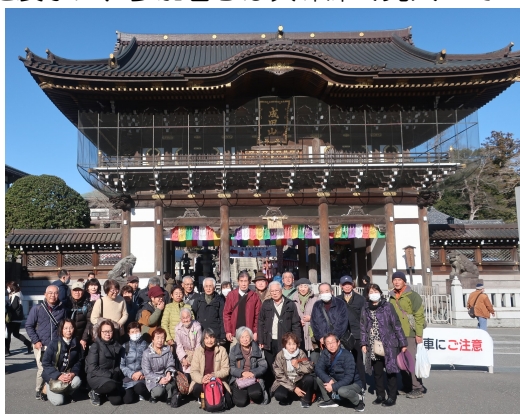
成田山新勝寺での集合写真▶

地域の高齢者団体「しあわせクラブ」と合同で企画実施している「ふれあい遊学塾」(3回シリーズ)。「感染症予防講座」(8月9日)、「ポチャ大会」(10月19日)に続く最終回は「航空科学博物館と成田山新勝寺」の社会見学を1月17日に実施しました。航空科学博物館では、大型旅客機の客席や実物大のジェットエンジンなどが再現された展示に、参加者らは興味深く見入っていました(写真上)。参加者アンケートで来年の企画を尋ねると自然観察や史跡探訪、博物館めぐりなどの企画希望が目につきました。来年度の企画にもご期待ください。