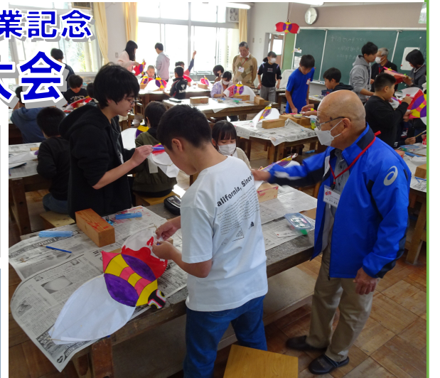
▲せんみ凧の色付けをする児童の皆さん【1月19日】

※雨天の場合は体育館で行うため、 見学はできません。 ※駐車場はありませんので、徒歩 または公共交通機関などのご利用 をお願いします。