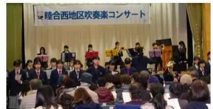
写真は昨年の様子「若い子の演奏で元気をもらいました。」と声が寄せられました。