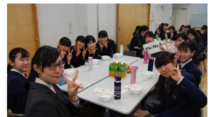
おいしい豚汁を囲み、高校生が企画した楽器グループ別の交流会も大盛況