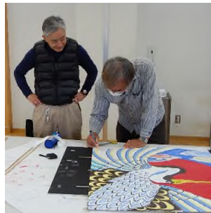
昨年の教室の様子

事前に和紙に絵を描いてもらい、 凧づくりを教わります。 組み立て後は、凧をあげます。