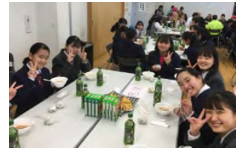
演奏後の交流会は、豚汁を囲み高校生が企画したゲームで盛り上がった