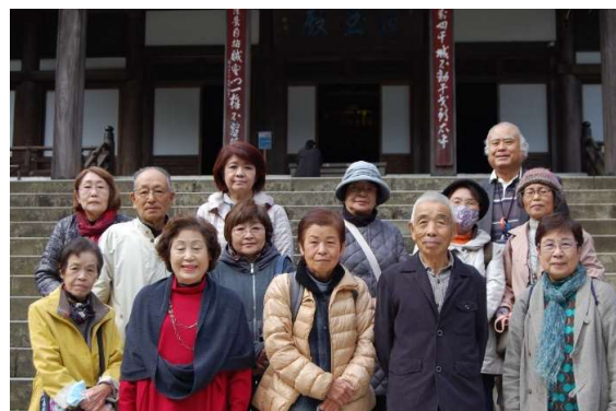
歴史散歩教室に参加した皆さん

同寺は、開創以来600年の歴史をもつ関東の霊場として知られ、境内山林130町歩、老杉茂り霊気は満山に漲り、堂塔は30余棟に及んでいます。参加者たちは、秋色に染まる境内にあるモミジなどの写真を撮って秋の一日を楽しみました。