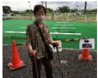
ワクチン接種を終えた89歳女性

あっという間に終わり、安心しました。皆さんに、手際よく親切に誘導していただき、うれしかったです。