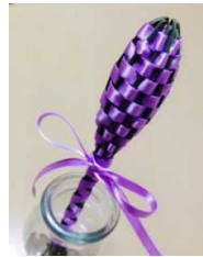
〈ラベンターバンドルズ〉

※コロナ禍の状況により、実施方法を変更する場合があります。その場合、対象者には、連絡をします。