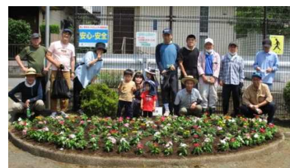
「粹生倶楽部」の皆さん

団体は、市の花未来事業のボランティアとして、年二回、花の苗を植え付けしています。地域の力で公園が明るくなりました。