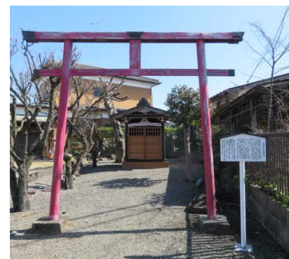
上依知二六三番地付近

平安朝前期、右大臣菅原道真は、藤原時平らの讒言により大宰府へ流配となり、二年後非運の死をとげる。それ以降京都では、藤原一族の相つぐ死や清涼殿への落雷、日照りや疫病の発生などの災いが長く続いた。人々は、これを道真公の怨霊の祟りだとして噂は巷に拡がった。 朝廷もついに動かされ、京都北野にすでに祀られていた火雷神の傍に道真公の霊廟を建て、天満大自在天として祀りその霊を慰めたという。その後、天災は止んだと伝わる。道真公を天神とする信仰は全国の天神社に広がり、名称も天満宮にかわっていった。 鎌倉時代以降には学問・文筆の神様として尊信されている。当地の天満宮は、江戸期寛永四年創建。